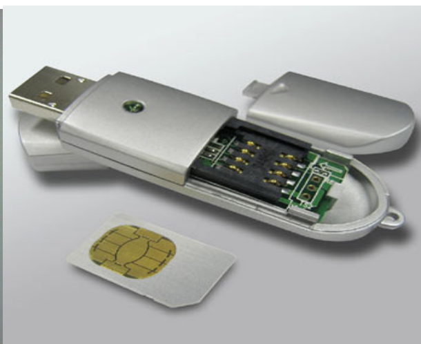
Lettore Smart Card USB formato "Token" (esempio)