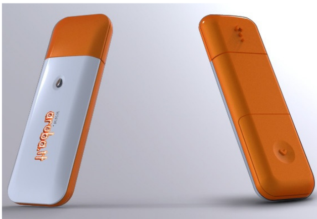
Lettore Smart Card USB formato "ArubaKEY" (esempio)