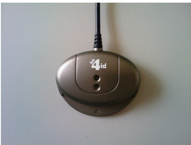
Lettore Smart Card USB formato standard (esempio)